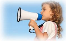
Het zuivere kindbelang