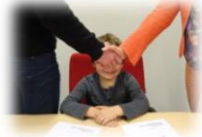
Het kindbelang zuiveren